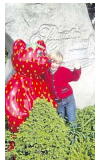
„Erd-Bäriger“ Spaß auf dem Schmücker Hof in Kirchhellen.

Meldungen für diese Rubriken unter Tel. (023 62) 92 77 41 oder kirchellen@dorstenerzeitung.de