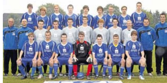
Die A-Jugend verlor Freitagabend gegen die U19 von RuWa Dellwig mit 0:1.

E3 - SV Horst 08 III 3:2 Es war ein erwartet schweres Spiel gegen einen starken Gegner aus Horst. Am Ende war es aber aufgrund der vielen Torchancen des VfB ein hochverdienter Sieg.